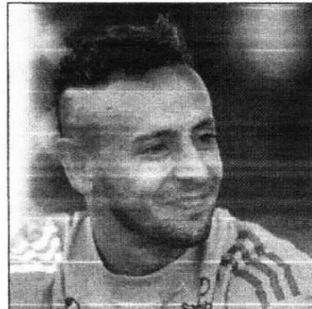
Rafinha pretende encerrar a carreira onde começou, no Coritiba

Além de Rafinha, o Coritiba também apresentou ao zagueiro Miranda. Ele joga atualmente pelo Jiangsu Suning, da China, e seu contrato termina no mês de julho. Há também o interesse do São Paulo e recentemente do Flamengo no jogador.